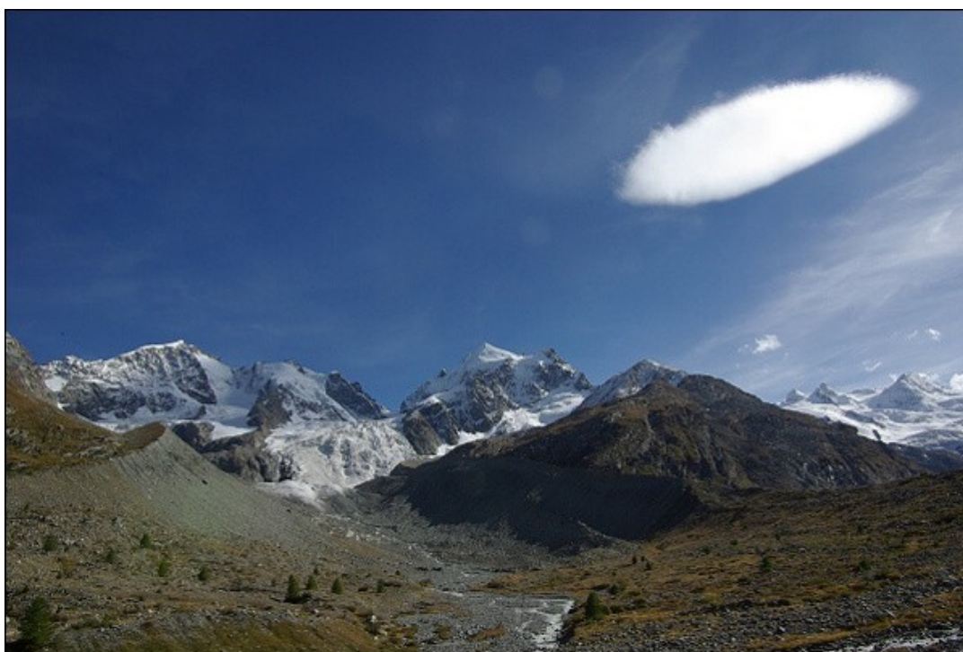
zleva Piz Bernina, Piz Scerscen a Piz Roseg; vpravo La Sella

Zaplátit parkovny, sbalit věci na čtyři dny a vyrazit. Tento den nás čekal přesun na horskou chatu Tschierva, v nadmořské výšce 2.573m, výchozí místo pro výstupy na čtyři okolní zaledněné vrcholy: Piz Morteratsch (3.751m), Piz Roseg (3.920m), Piz Scerscen (3.971m) a neznámější z nich Piz Berninu (4.049m).